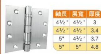
14 CS-3390 附二培林(C型孔)