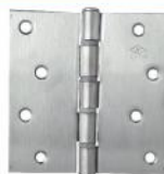
4 CS-3100 附尼龍圈