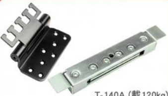
10 T-140A (載120kg) T-140B (載100kg)