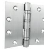
17 CS-3490 附四培林(C型孔)