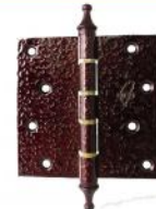
5 CS-1500 烤漆雕花(皇冠頭)