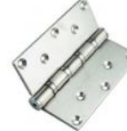
16 CS-3655 附四培林(N型孔)